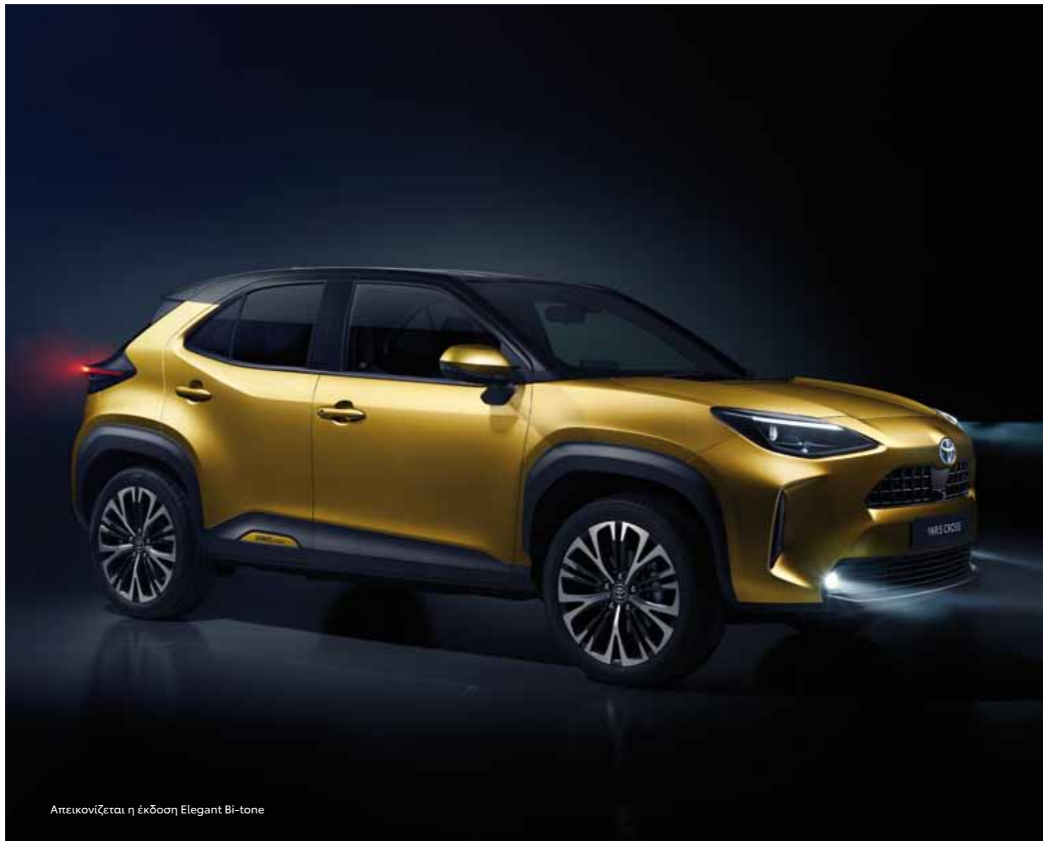
Απεικονίζεται η έκδοση Elegant Bi-tone

Εστιασμένο να αντανακλά την προσωπικότητα και τον τρόπο ζωής σας, η σχεδίαση του Yaris Cross βασίζει την έμπνευσή της στο ιδανικό σχήμα των πολύτιμων λίθων. Η φράση "αιχμηρό διαμάντι" αποτέλεσε την ψυχή της σχεδίασής του, η οποία εκφράζει απόλυτα το στιβαρό, τολμηρό αλλά και premium look του νέου Yaris Cross.