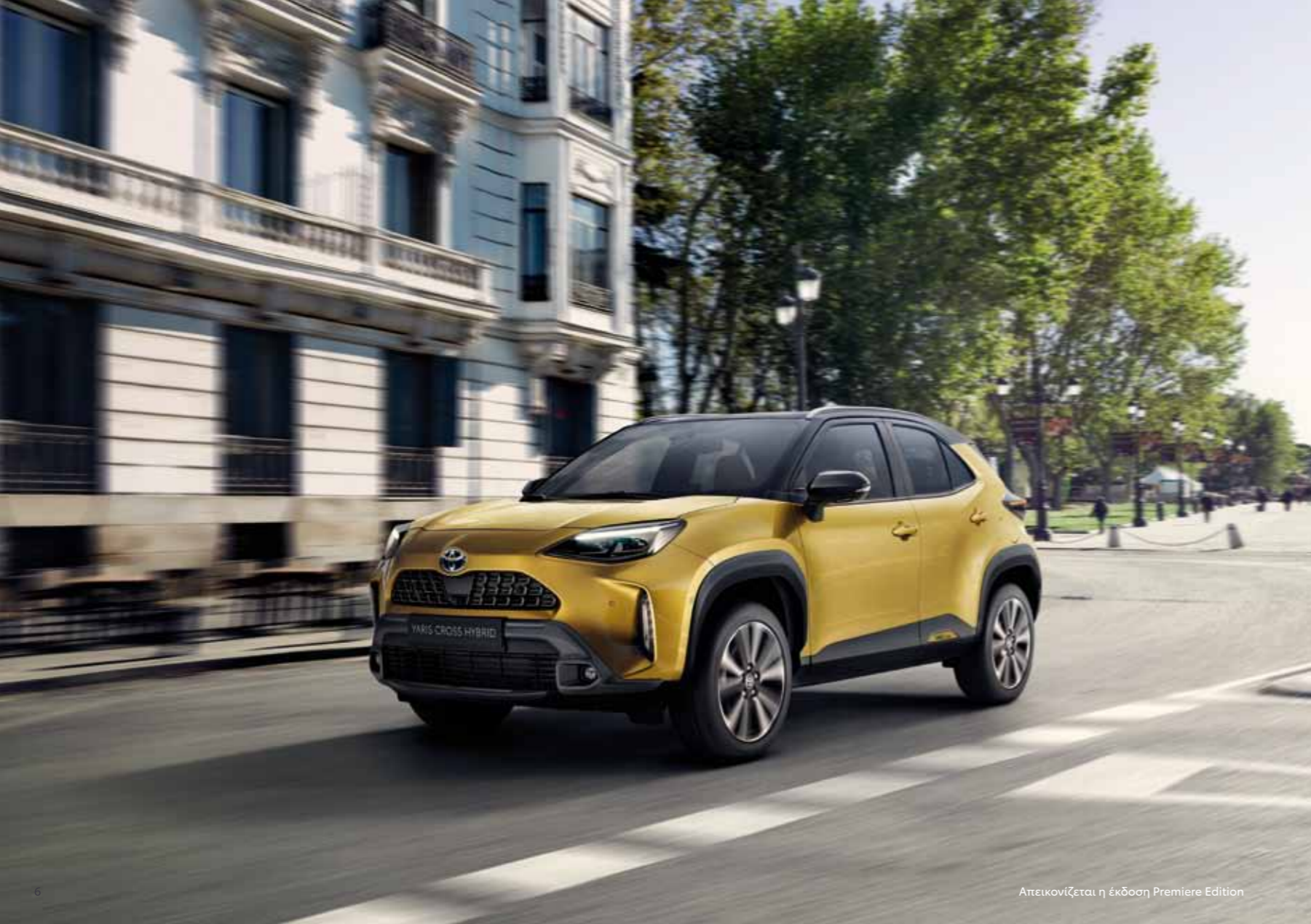
Απεικονίζεται η έκδοση Premiere Edition