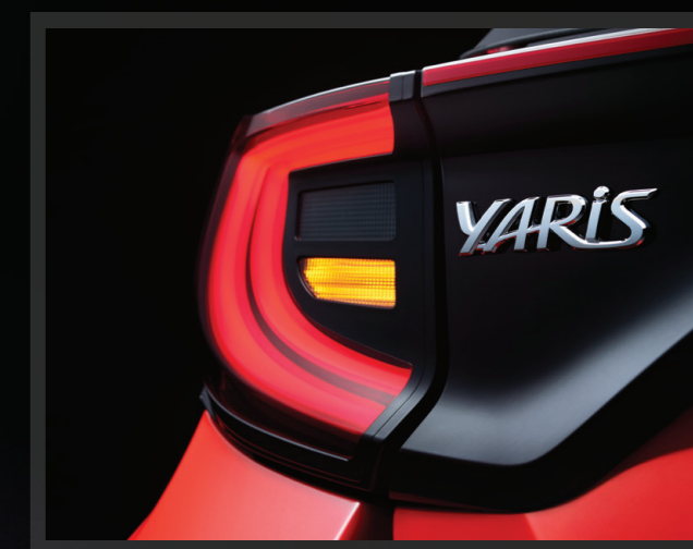
Πίσω φωτιστικά σώματα LED