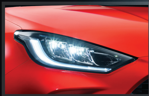
Εμπρός φωτιστικά σώματα LED